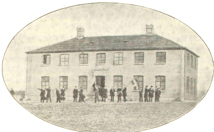
Høng højskole 1867 (set fra vest).