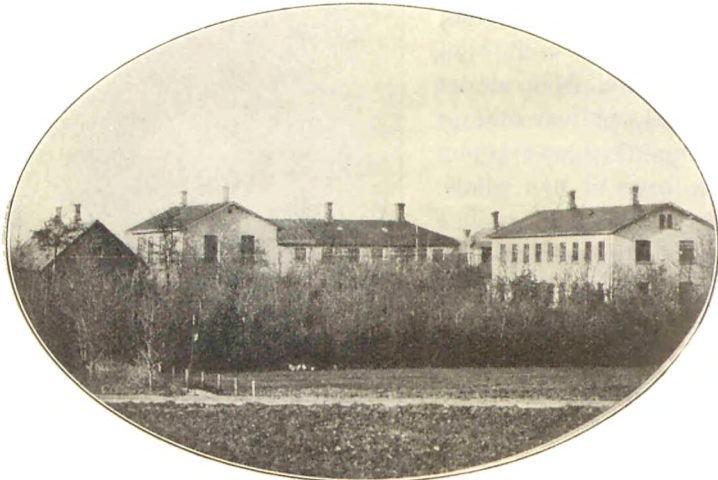
Høng højskole 1895 (set fra øst.**)