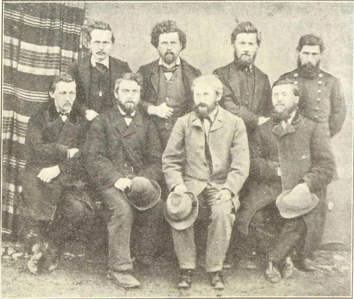
Hindholmlærerne 1869. *)