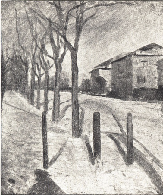
Platanvej i Vintersol, 1888. Tilh. Forfatteren Sophus Claussen.