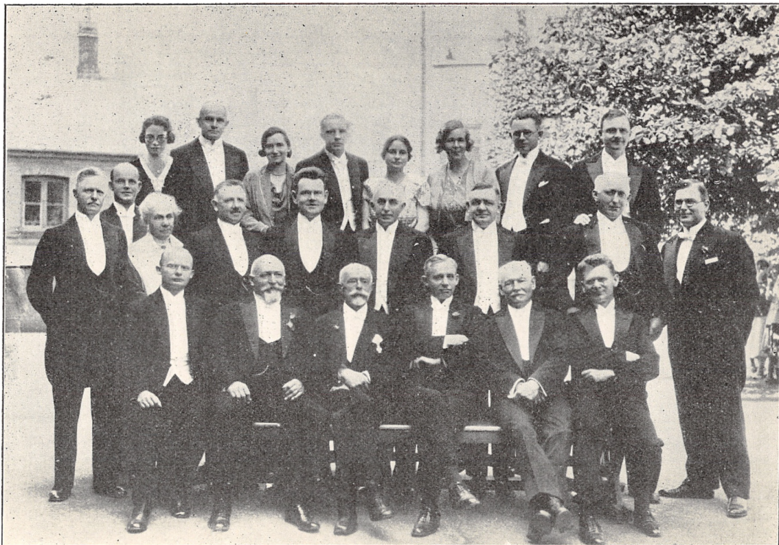
Skolens Lærere den 30. Juni 1932.