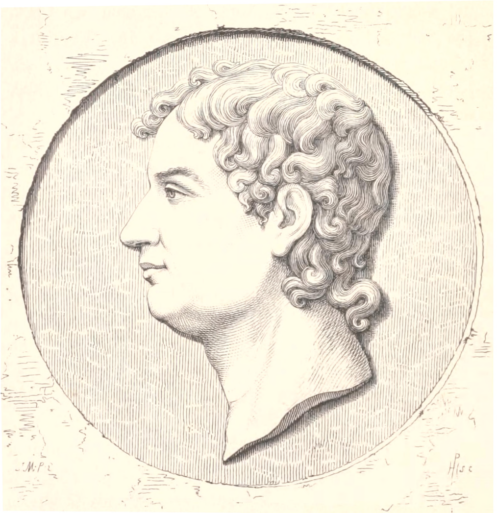
Medaillonen fra Gravmindet over Gyldendal.