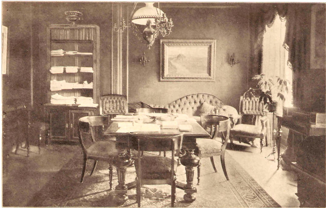
Bergs Arbejdsværelse i Frederiksgade.