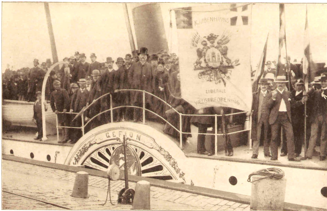
Udflugten til Helsingør 25. Juli 1886.