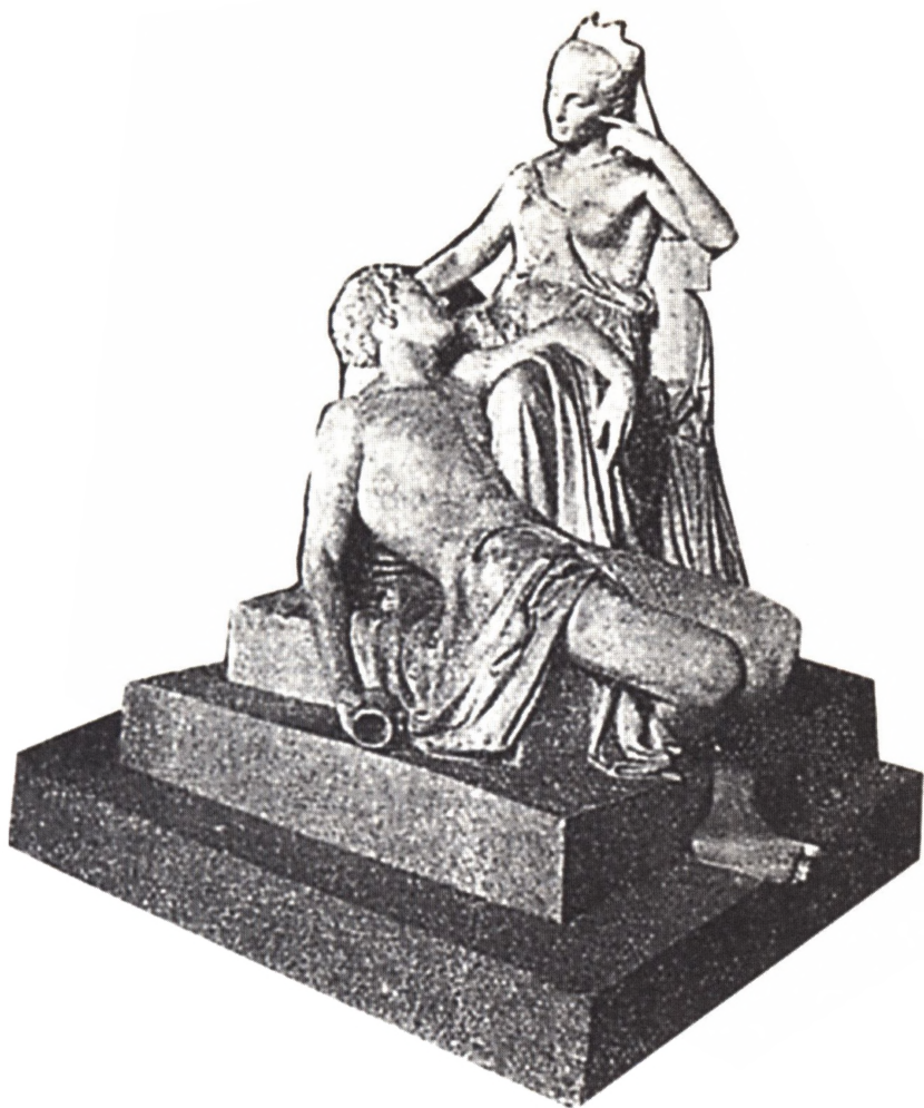
Fig. 3. Adonis og Persephone, udført af Rasmus Bøgebjerg. Fra Højskolebladet, 14. februar 1902, s. 194.

grundtvigskes store vennemøde; og dagen efter blev de fire præmierede udkast vist i dagbladene.