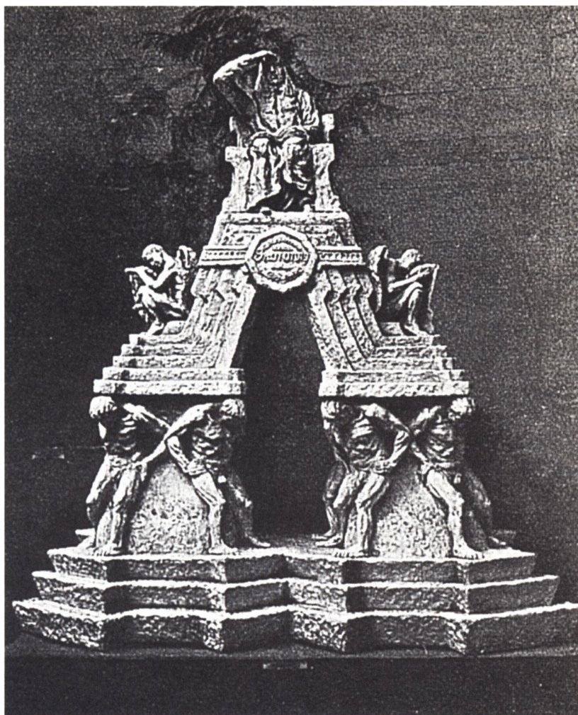
Fig. 10. Niels Hansen Jacobsen: Grundtvig på højsæde båret af kæmper. Fra J. Marstrand, s. 26.