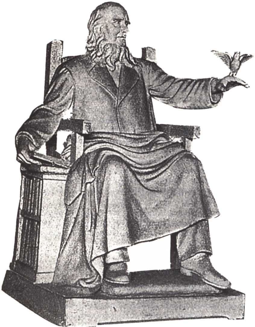
Fig. 1. Grundtvigstatue udført af Rasmus Bøgebjerg. Fra J. Marstrand: Grundtvigs Mindekirke paa Bispebjerg, 1932, s. 11.

Efter at have beskrevet sit værk udtrykker Bøgebjerg, at »den lille Fugl, den danske Folkefugl, Lærken, den er i Begreb med at flyve op, og Gr. ser med forhaabningsfuld Glæde paa den, som han har sat op til Flugt og Sang i Frihed. Det er just, hvad Gr. har gjort for den danske Folke-Aand, baade kristeligt og folkeligt. Jeg kan ikke tænke, at