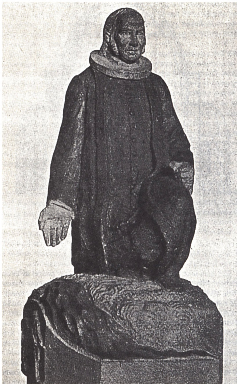
Fig. 5. Niels Skovgaard: Forslag til Grundtvigs Monument. Fra J. Marstrand, s. 18.