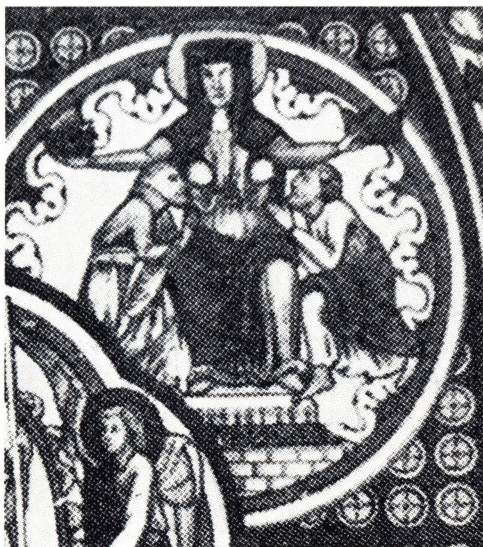
9. Ecclesia. Glasimaleri fra katedralen i Bourges, 1200-talet. Foto fra E. Male: L'Art religieux du XIIIe Siècle en France . Paris 1910. fig. 169.