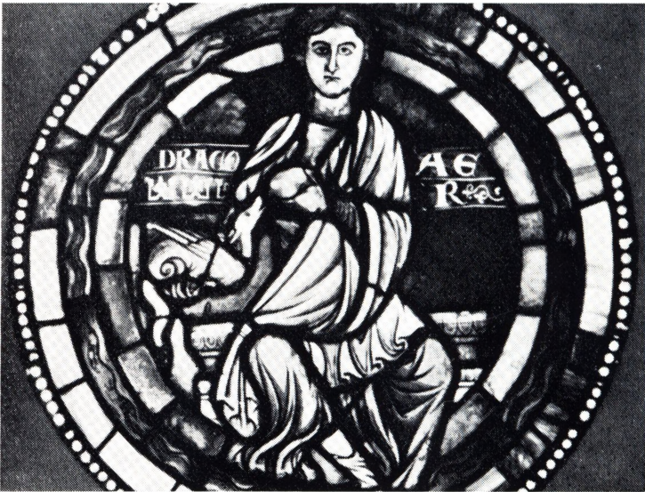
6. Aer. Glasmaleri fra Lausannekatedralens rosetvindue, ca. 1235.