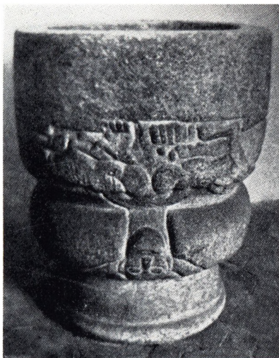
1. V. Egedefonten.