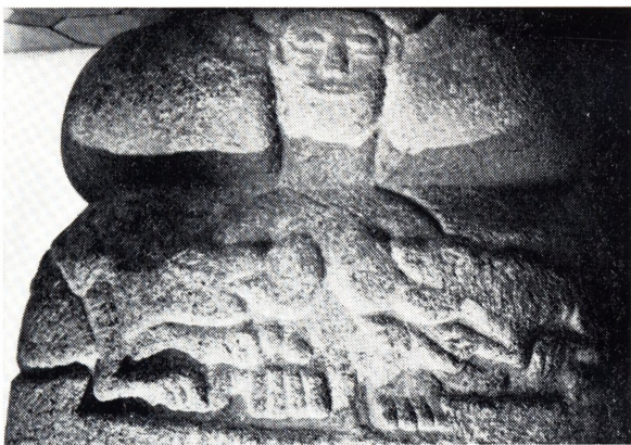
2. Mater Ecclesia, V. Egedefonten.