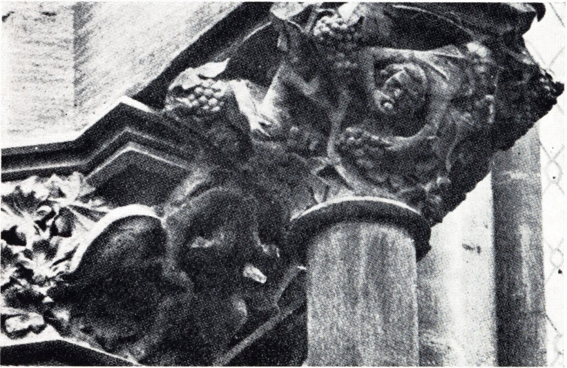
11. Ecclesia og de troende i vintræet. Skulptur på stræbepiller fra Strassburg domkirke, ca. 1225.