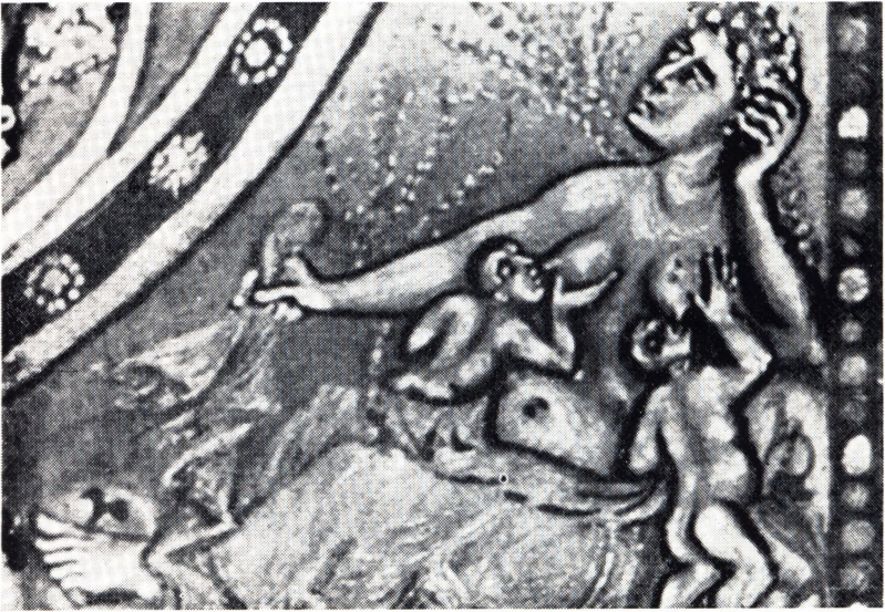
5. Terra. Sakramentarium fra S. Denis, ca. 870. Foto fra H. Swarzenski: Monuments of romanesque Art . London 1953. fig. 5:9.