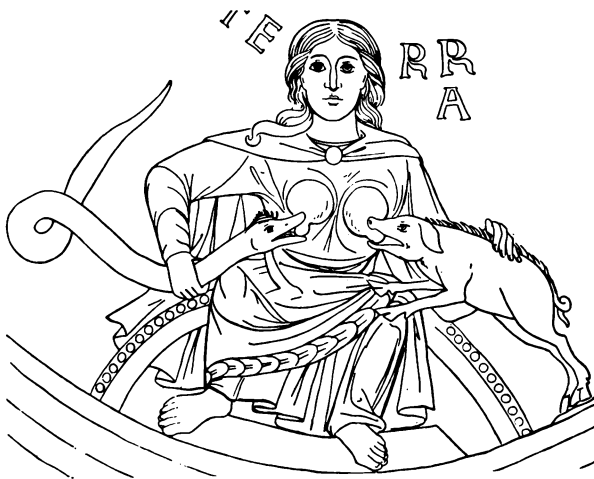
4. Terra. Kalkmaleri fra Limburgkatedralen, fra 1200-tallets første halvdel.

Vi står her overfor en i Middelalderens kirkelige Symbolik ret almindelige Fremstilling af 'Yppigheden' (Luxuria)«[2].