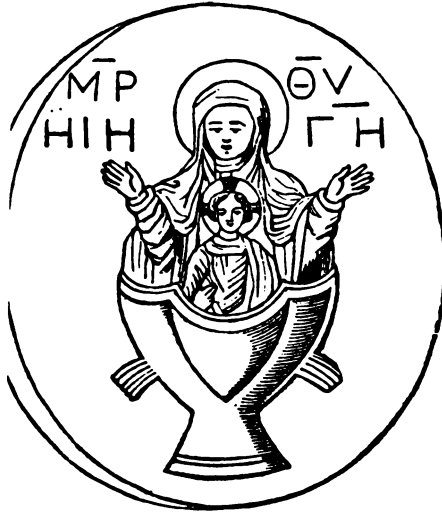
10. Maria med Jesusbarnet på sit skød siddende i en døbefont. Stenrelief i Vettorimuseet, 1200-tal?.

Vettorisi Museum (fig. 10). Her sidder Maria med Jesusbarnet på sit skød i en døbefont, fra hvilken to synlige vandkaskader vælder. Denne skulptur kan siges at illustrere et par passager skrevet af Robert fra Deutz, hvori det hedder: »Dividentur, inquam, viventes aquæ in ista quatuor capita«[23] og videre »Similiter aquæ scripturarum ex te, soror mea sponsa, dulcescunt ex utero tuo, sive per uterum tuum vivents factæ sunt«[24]. Heri sammenlignes Marias skød indirekte med en font, og når Maria og Ecclesia ofte er parallelliserede med hinanden, kan disse to fremstillinger siges at bruge det samme billede, nemlig fonten eller kummen som et skød.