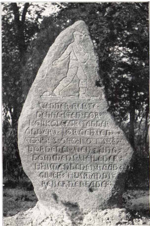
Mindestenen i skolens have.