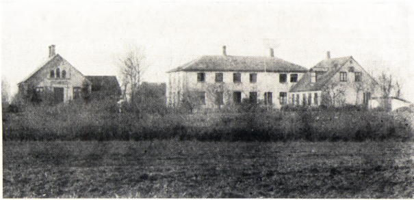
Høng højskole o. 1885 (set fra øst).

Fra venstre Harrekildes hus (med udhus). Sydenden af gymnastiksalen. Hovedbygningen. Tilbygningen 1874.