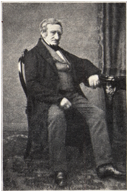
GEHEIMEKONFERENSRAAD JONAS COLLIN (1776—1861)

og Udskud og dog var forblevet ren og uskyl- dig og gennemsigtig som en Dugdraabe, og af den