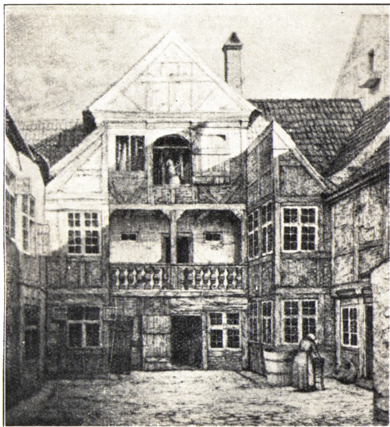
DEN COLLINSKE GAARD I AMALIEGADE

og bitter Klage, hvor ondt han dybest set har det hos dem han elsker højest. Eks. i Brev til