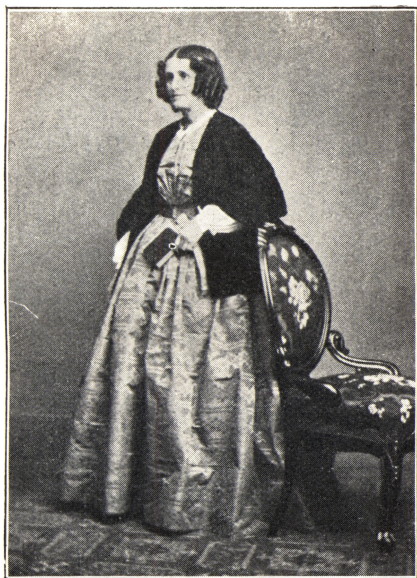
JETTE COLLIN SOM UNG (1813—1894)

af Italien, siger jeg altid: Bøgeskoven, Jette Tyberg og vore Kløvermarker. Hils altsaa Nr. To