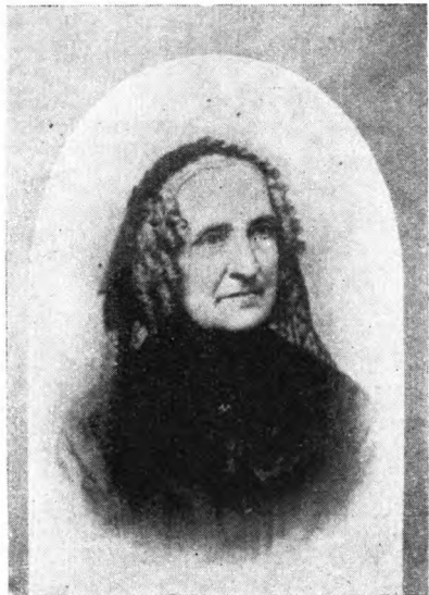
Jakobine Tersa Juel, f. Wolf, 1818-89.