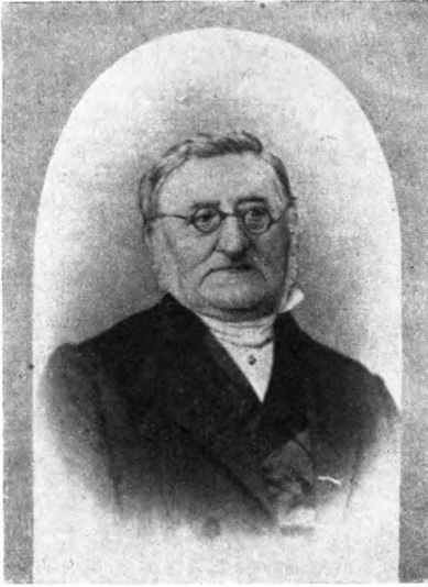
Ejler S. Wolf, 1800-88, Provst.