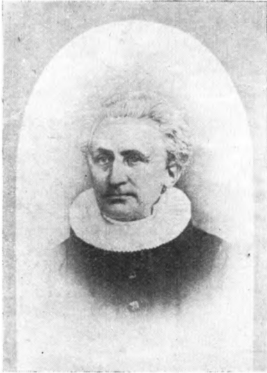
Halvor Emil Wolf, 1812-91. Præst.