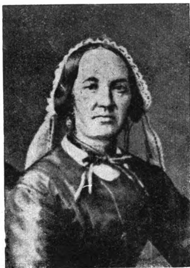
Vilh. Emilie Wolf, 1817-86.