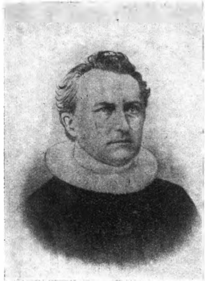
Christen Wolf, 1814-84. Præst.