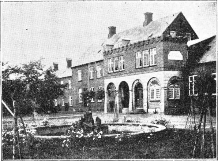
Den gamle Hovedbygning paa Vestjysk Gymnasium.