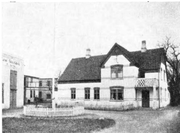
Tarm Stole- og Møbelfabrik.