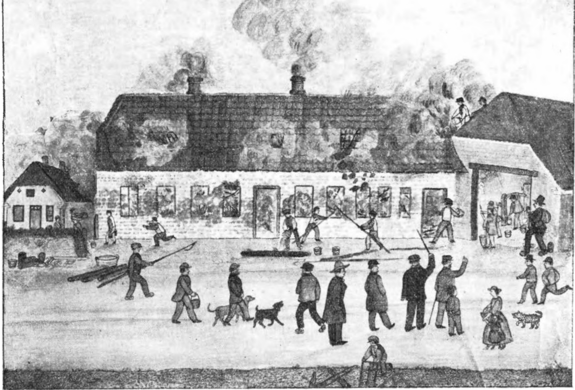
Efter Tegning af Andr. Beiter.