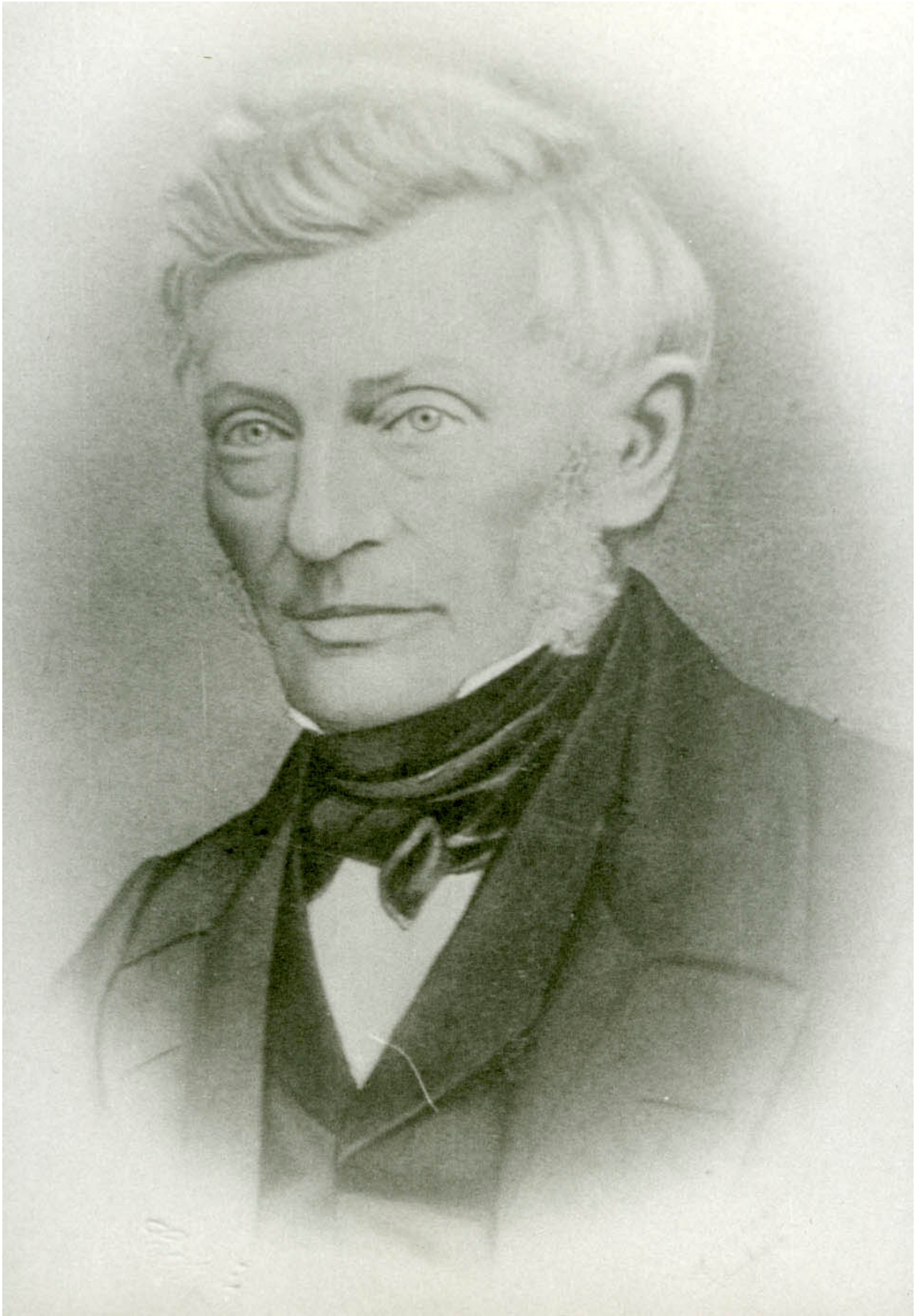
M.G. Krag (1794 – 1864)