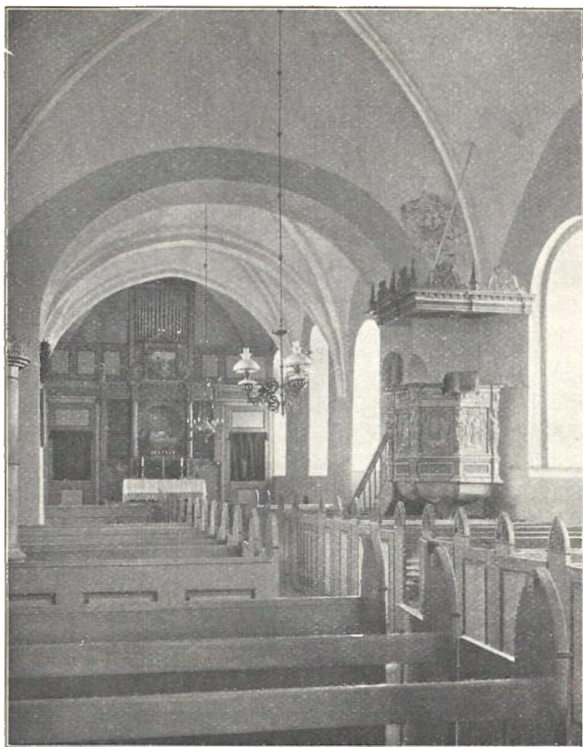
Kjærum Kirkes Indre.

Kalkmalerier kom til Syne 1886 1) ); men de vare vanskelige at restaurere, og der ses nu kun Spor af en Rytter paa