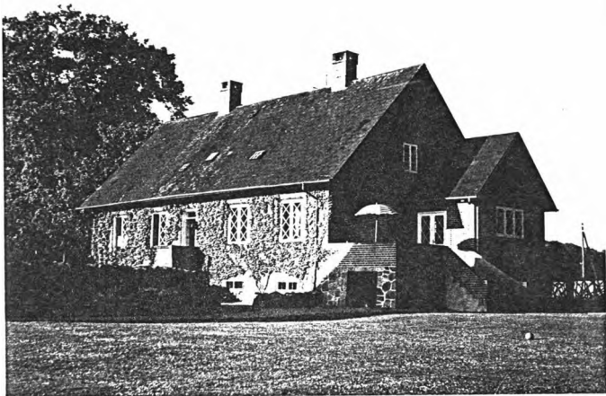
Foto 1956 af "Gartnerboligen" nord for Frijsenborg Slot, her boede Far og Mor fra 1944 til 1968.