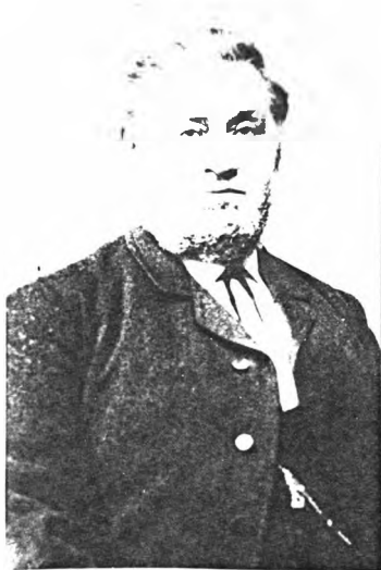
(6) Carl Vilhelm Philipsen Fotograferet Kbhvn. ca.1900. Læs om ham på side 9 her!