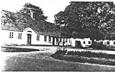
Nørgaard-slægtens gård i Billund i Jægerup sogn ved Haderslev. Fotograferet ca.1960.