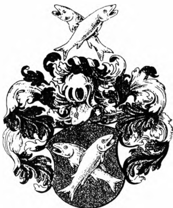
Slægten "Winther's" våben fra Astrupgaard i Brøns sogn - læs herom side 71-72!