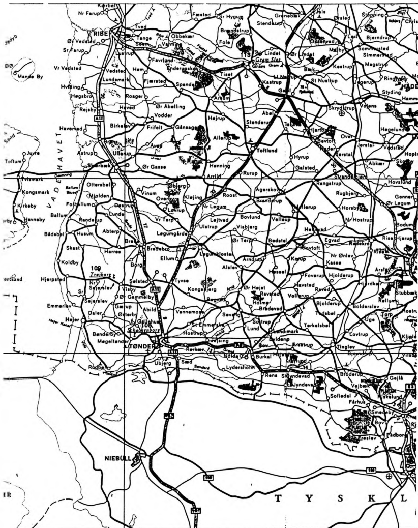
Det sydvestligste hjørne af Jylland, som er hjemegnen for denne slægts aner gennem 14 generationer!