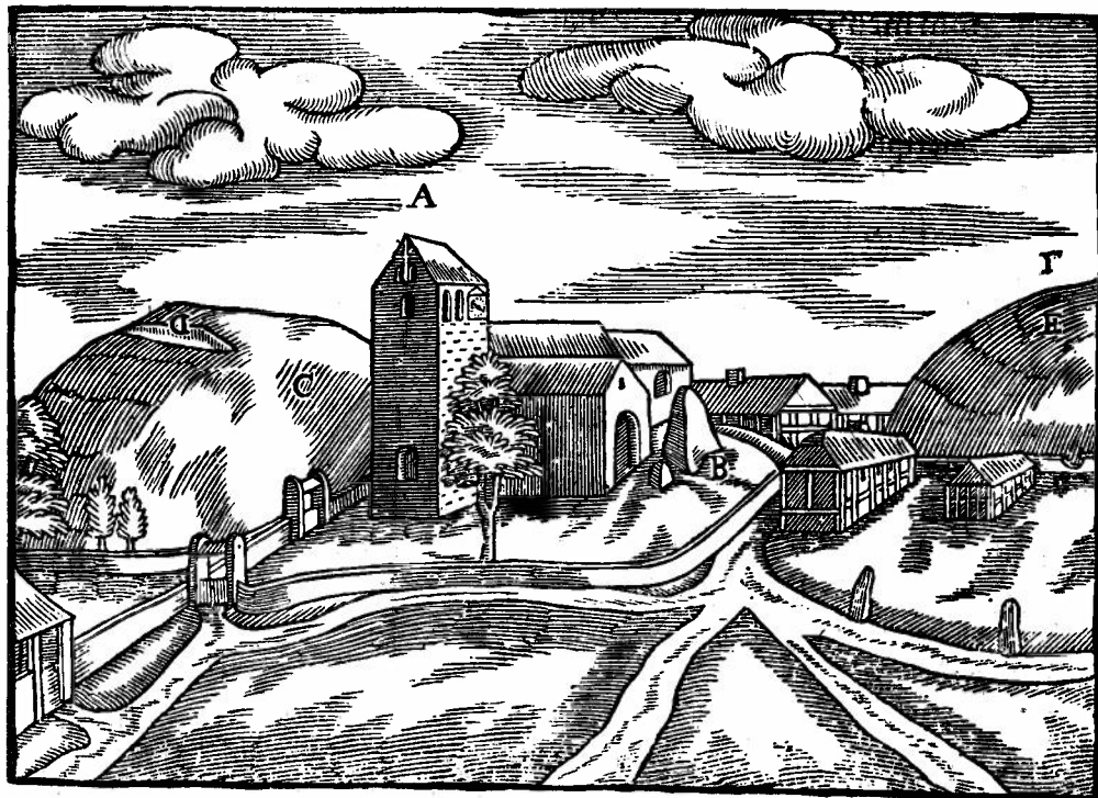
Billede fra Jelling 1643 (Worms Monumenta Danica).

A: Kirken. B: Den store Runesten. C: Den nordre Høj. D: Dammen. E: Den søndre Høj.