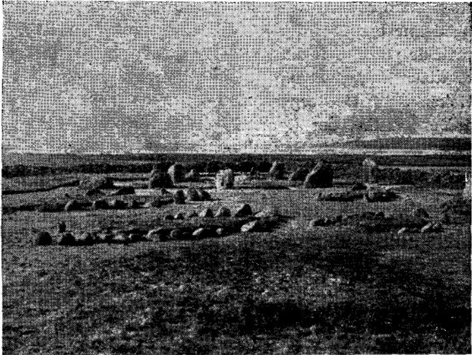
Et Fotografi af Skibssætningerne paa Hjarnø.

Den vigtigste af alle de danske Gravpladser, hvorpaa der har ligget Skibssætninger, er dog den, der findes paa Hjarnø i Horsens Fjord. Det er tillige en af den danske Oldforsknings klassiske Lokalteter, som allerede Ole Worm har fundet værdig til Omtale.