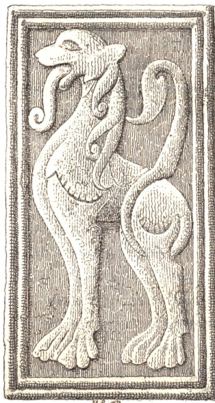
1 Al. 11 Tom. høi, 18 \frac{1}{3} Tom. bred

i Almindelighed at legemliggjøre Opfattelsen af Sagnverdens gaadefulde og fantastiske Optrin, eller blotte Former af ren decorativ Betydning. Ved Portalen her se vi tilhøre — Øst — en Løve, hvis rige Manke falder i pyntelige Lokker ned over Halsen, og tilvenstre en bevinget Grif, hvor Bagkroppen er tildannet som en vifteformet Hale. Reliefferne omgives af Rammer, paa hvis dobbelte Rundstave vi gjenfinde svage Spor til den saa meget yndede Tougnsnoning. Skjøndt vi vistnok maa indrømme, at disse to Arbejder bære det samme strengt typiske Præg, der overalt møder os i vor tidligere Middelalders Sculpturer af denne Art, og skjøndt Tidens hele Naivetet paa Plastikens Omraade saa stærkt er udtalt igjennem dem, saa vidne de