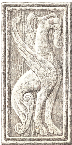
1 Al 11 \frac{1}{3} Tom. høi, 17 Tom. bred.

Skikkelser med en dyb symbolsk Betydning til visse kristelige Forestillinger, men ligesaa ofte synes de enten at være umiddelbare Udtryk for den tidligere Middelalders Lyst til