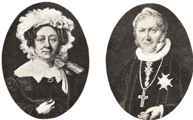
BISKOP JACOB NEUMANN OG HUSTRU.

Biskop Neumann var en meget yderliggaaende rationalist; dog blev han paa sine gamle dage endel paavirket af Mynster. Hans katekismus-udgave af 1813 kan maaske betegnes som rationalismens sidste betydelige livsytring i Norge og Danmark, men betegner tillige et vendepunkt, da den vakte autoriteterne til eftertanke og ikke blev approberet. Han var levende interesseret i historisk granskning, paa hvilket omraade han leverede meget, der har blivende værd, særlig i det bergenske tidsskrift «Urda». Tillige